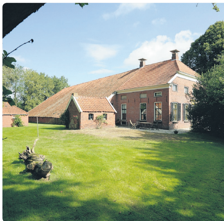
Monumentale Oldambtster woonboerderij.

woonkeuken met balkenplafond, schouw en plavuizenvloer. 'Je waant je even terug in vroeger tijden,' aldus Johan Buter. Maar aandachtige beschouwer zal het niet ontgaan dat het woongedeelte van eigentijds comfort is voorzien.